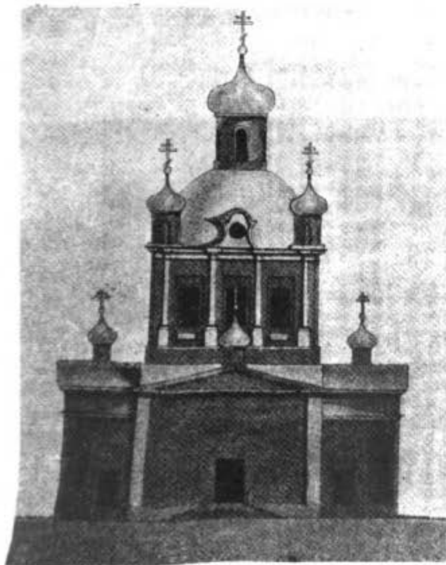
Типы старинныхъ церквей для современныхъ построекъ.

Въ проведеніи борьбы они всѣ объединились.