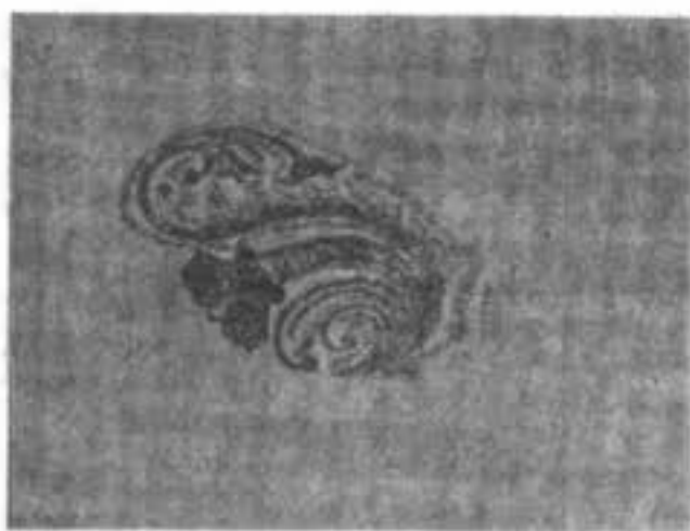
Концовая заставка изъ поморской нотной «Триоди цвѣтной» нач. XVIII в.