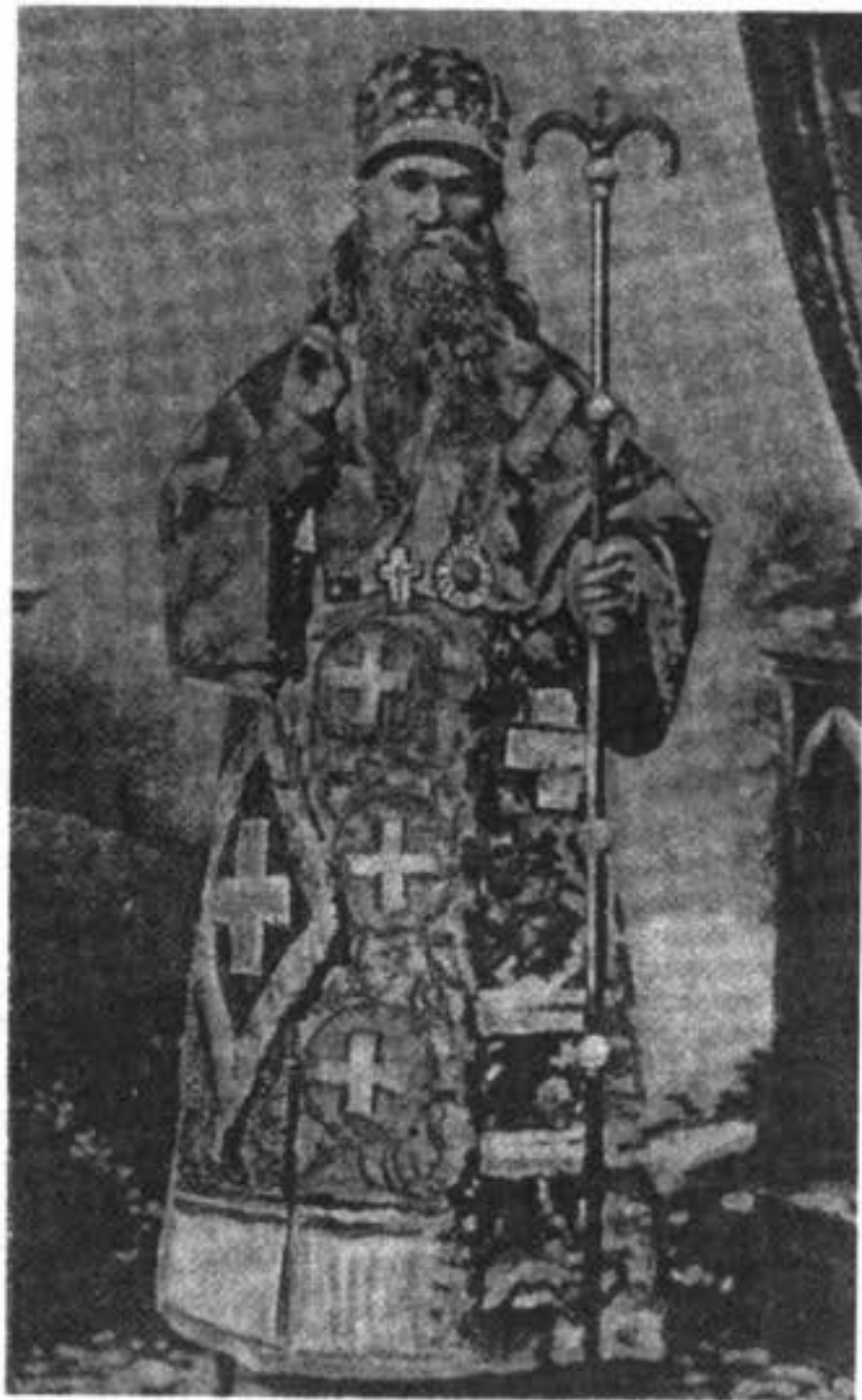
Архіепископъ Аркадій Славскій (провелъ въ заключеніи въ Суздальскомъ Спасо-Евфиміевомъ монастырѣ 27 лѣтъ).

скую полицію съ тѣмъ, чтобы она касательно оныхъ сдѣлала со своей стороны законное распоряженіе, и по передачѣ донести мнѣ". Приказаніе это было, разумѣется, исполнено, деньги и червонцы Алимпія переданы въ полицію, отъ которой вскорѣ и послѣдовало увѣдомленіе о томъ, что деньги и червонцы получены и записаны на приходъ *).