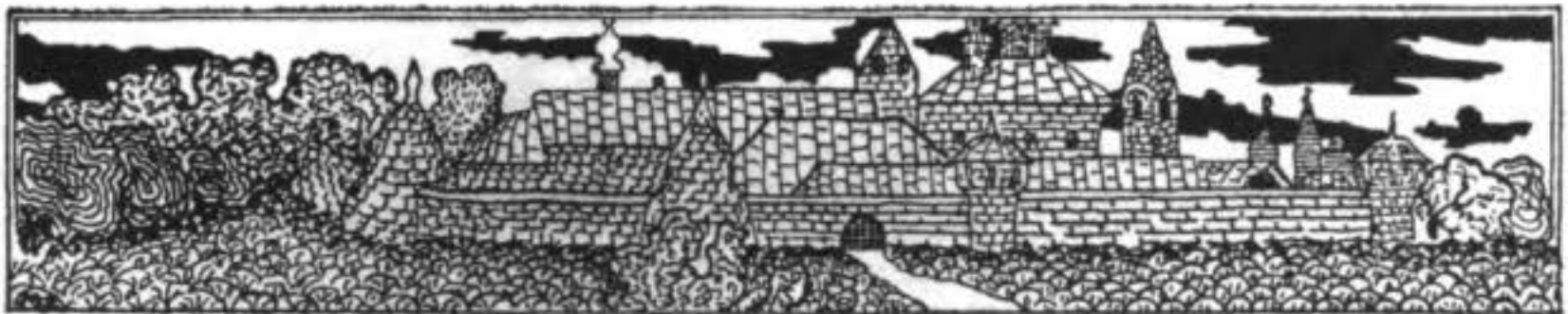
Суздальскій Спасо-Евфиміевъ монастырь.