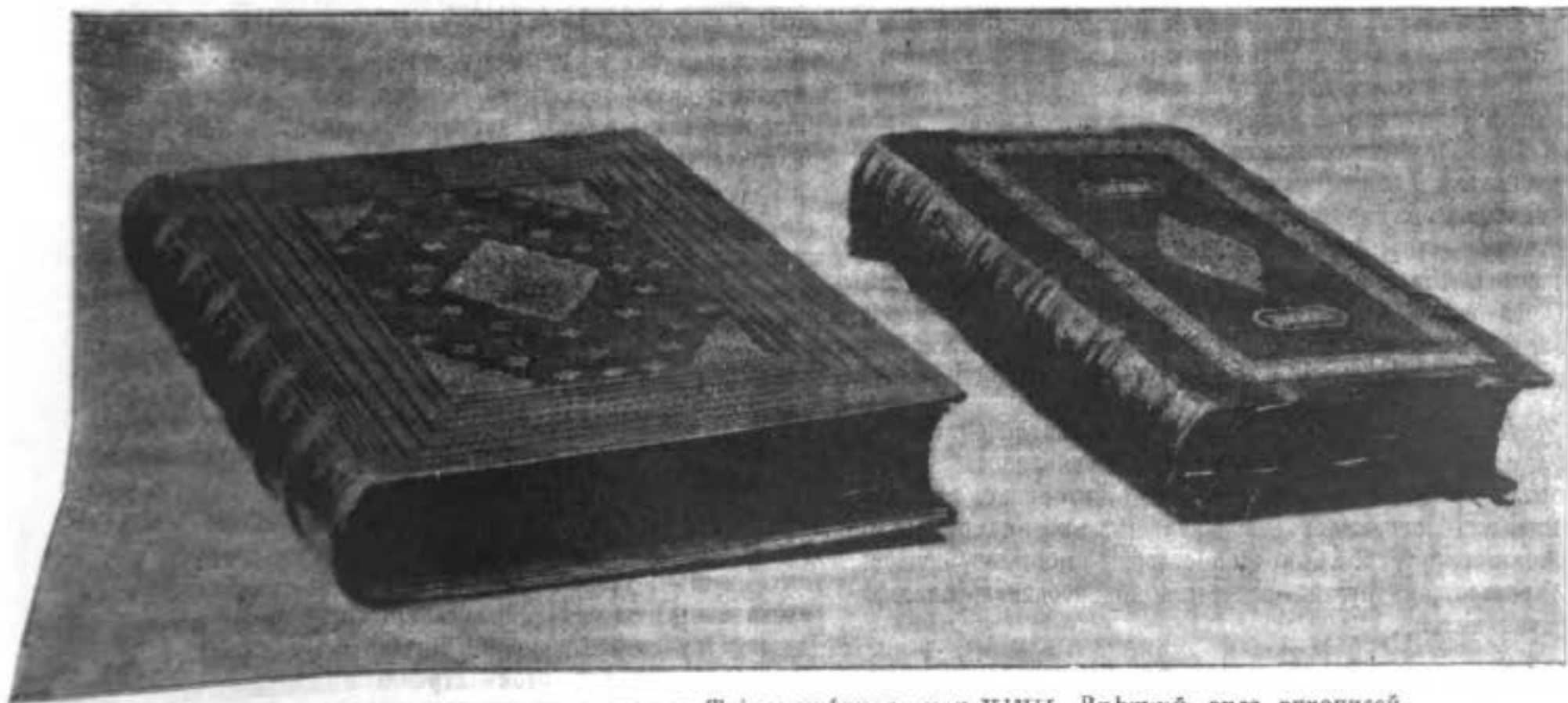
Липцевой Апокалипсисъ поморской в „Тріодѣ цвѣтной“ нач. XVIII. Внѣшній видъ рукописей.