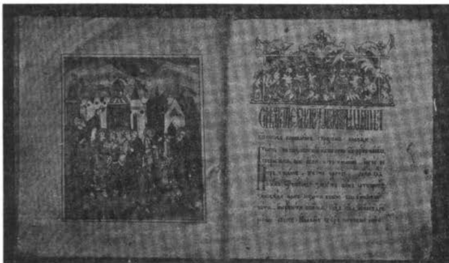
Миніатюра изъ рукописнаго лицевого «Житія Іоанна Богослова», XVIII в.

«Житіе Іоанна Богослова»; рукопись лицевая, писаная полууставомъ, XVIII в.