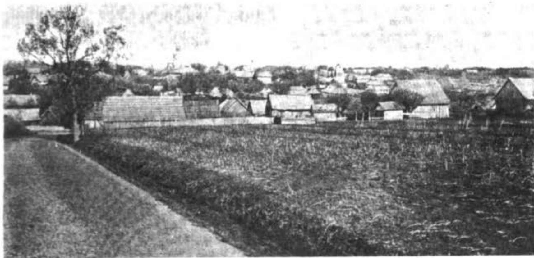
Селеніе Климоуды, въ Буковинѣ, въ Австріи. (Одинъ изъ центровъ зарубѣжныхъ старообрядцевъ).

Эти трапезы были для погостанъ-прихожанъ мѣстомъ собраний и мірскихъ постановленій не только по церковнымъ, но и по гражданскимъ дѣламъ. Такое предположеніе К. Неволіна нашло себѣ полное подтвержденіе въ актахъ холмогорской и устюжской епархій, изданныхъ Археографическою комиссіей (т. XII и XIV „Русской Исторической Вибліотеки“, 1890—1894 г.). Изъ этихъ актовъ (обнимающихъ пространство времени съ 1500 по 1699 г.) усматривается, что съ незапамятныхъ временъ при городскихъ и сельскихъ церквахъ Холмогорскаго и Устюжскаго края, какъ равно и при церквахъ Новгородской области, были устроены въ западной части церкви теплыя трапезы. Эти пристройки, примыкавшія непосредственно къ церкви и составлявшія съ ней одно зданіе, занимали пространство почти одинаковое съ самой церковью вмѣстѣ съ алтаремъ, но были отдѣлены отъ по-