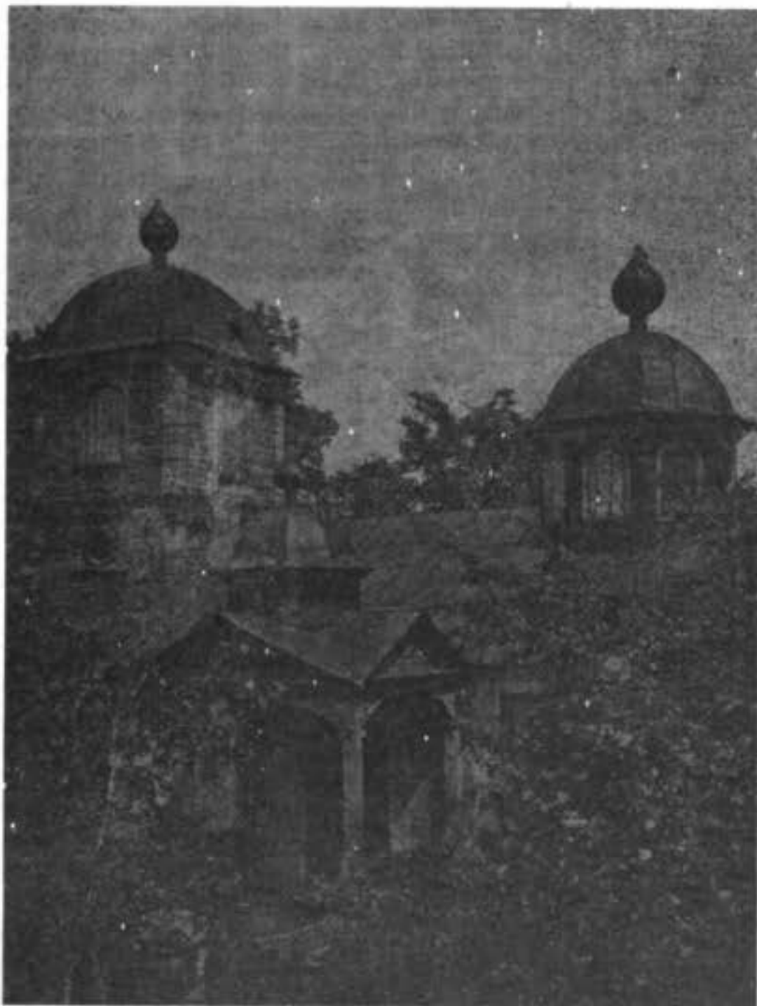
Старообрядческая «Львовская часовня» въ г. Вольскѣ, Саратов. губ. Кресты сдѣланы при Николаѣ I.

въ вольской общинѣ назрѣла потребность въ созданіи своей приходской начальной школы, въ которой дѣти прихожанъ могли бы отъ своего духовнаго наставника получать наставленіе въ правилахъ вѣры и христіанской нравственности и по желанію изучать древнее „знаменное“ пѣніе, слѣдствіемъ чего могъ бы явиться большой приходскій хоръ любителей, пѣвцовъ по призванію, отдающихъ дѣлу всю свою душу. Осуществленіе этой мысли