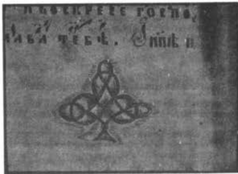
Концевая заставка изъ поморской ктной «Триоди цвѣтной» нач. XVIII в.