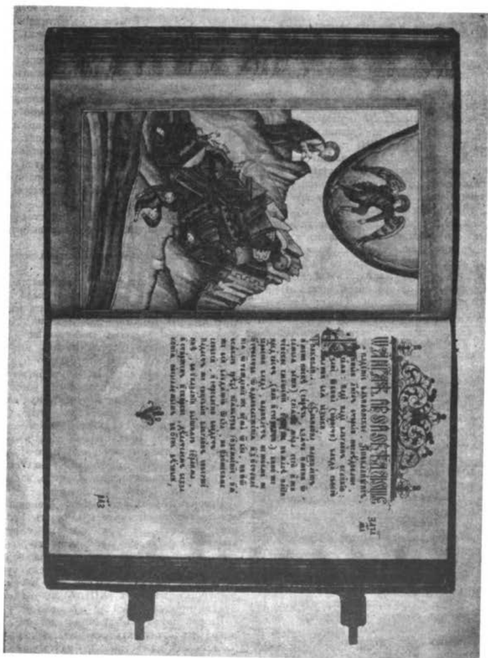
Апокалипсисъ, поморск. письма нач. XVIII в. Одна изъ миниатюръ—«паденіе вавилонское»

вать всякаго, кто не будетъ поклоняться ему (посредствомъ разряда электрической искры, которая будетъ безвредна для носящихъ особья раздаваемые имъ амулеты съ именемъ или числомъ звѣря).