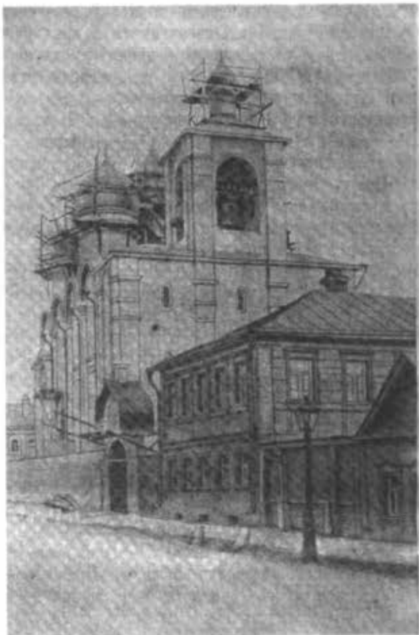
Новый старообрядческій храмъ Успенія Пресв. Богородицы въ Москвѣ, на Апухтинкѣ.

Сегодня, въ воскресенье, 6 іюля, состоится торжественное поднятіе свв. крестовъ на новый старообрядческій храмъ въ Москвѣ во имя Успенія Пресвятыя Богородицы, что на Апухтинкѣ, и закладка престола. По окончаніи Божественной литургіи, изъ храма Живоначальныя Троицы,