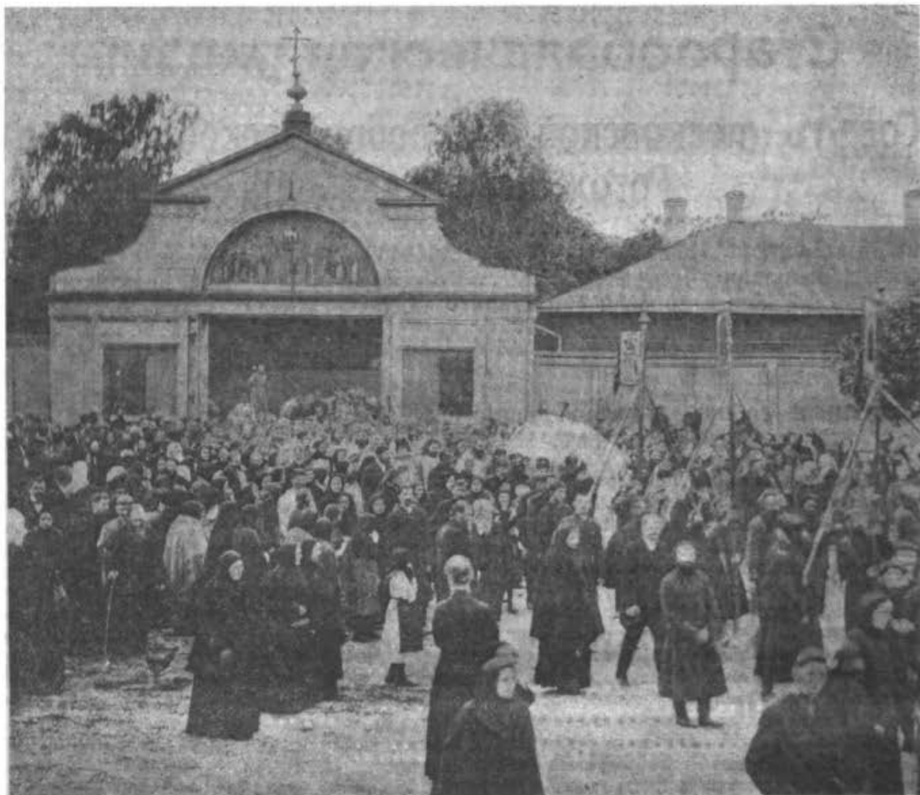
Похороны священника о. Тимофея.

Тѣло почившаго мѣстнымъ іереємъ о. Аврааміемъ было облечено въ священническія одежды и положено въ металлическій гробъ; на груди были положены: св. крестъ и св. Евангеліе.