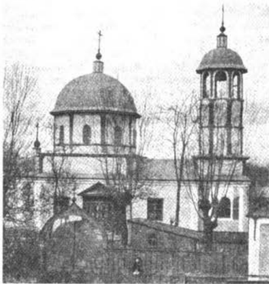
Старообрядческая деревянная церковь въ Галацѣ, въ Румыніи, построенная въ 1862 году, во имя св. Николы Чудотворца.

Галацъ помимо кореннаго населенія румынъ и молдаванъ еще населенъ и русскими выходцами: скопцами и старообрядцами разныхъ согласій; самые многочисленные изъ нихъ это—старообрядцы Австрійскаго или Бѣлокриницкаго согласія, насчитывающіе до 500 душъ обоюго пола и только они одни имѣютъ здѣсь свой не-