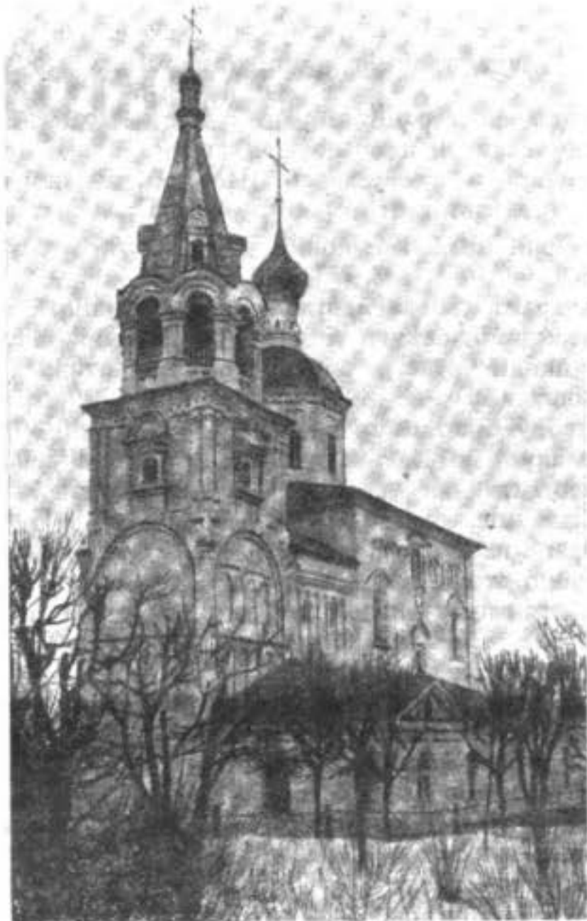
Рождественская церковь въ Боголюбѣ съ сѣверо-западной стороны.

И въ Боголюбѣмъ верхъ златомъ устрои и каморы позолоти и поясъ златомъ устрои и камнемъ усвѣти и столпъ позолоти изъвну церкви и по каморамъ питки