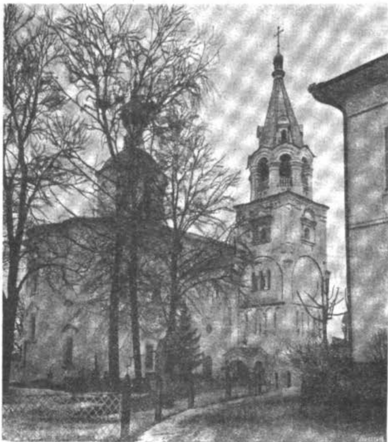
Рождественская церковь въ Боголюбѣ съ восточной стороны.