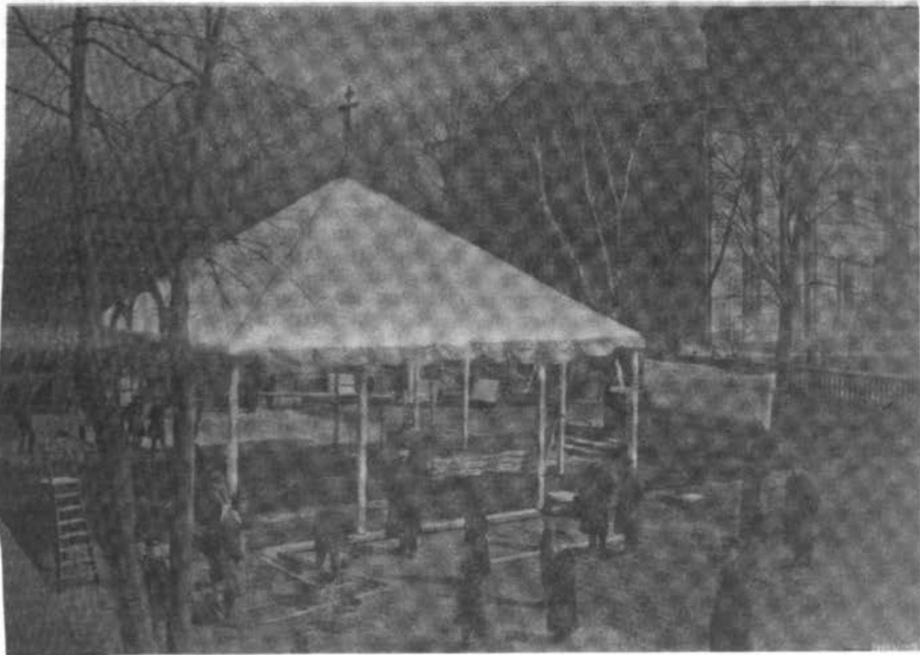
Мѣсто закладки колокольни на Рогожскомъ кладбищѣ въ Москвѣ.

По благоволенію Божію и милости Царской, въ на-