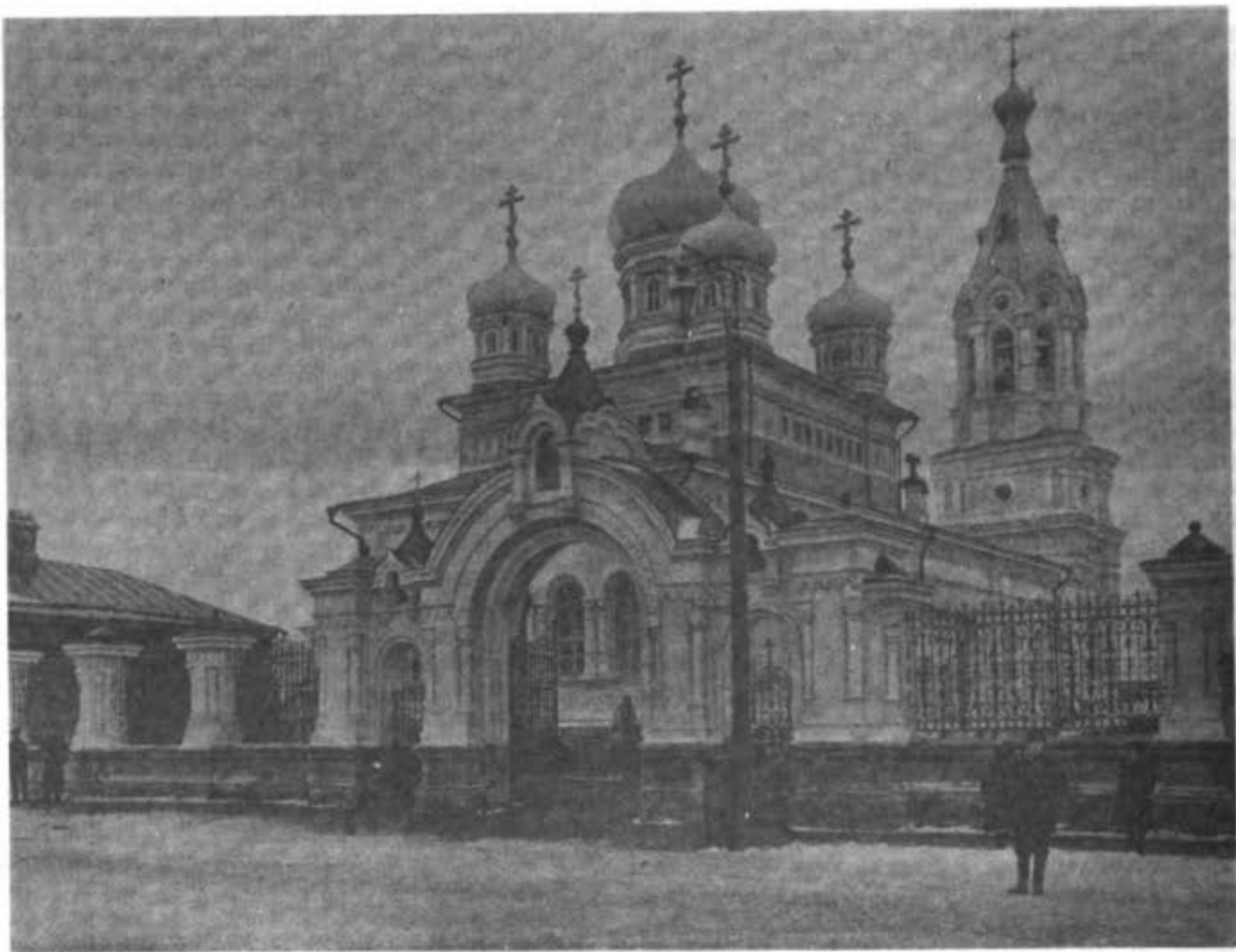
Старообрядческий храмъ св. Великомученика Георгія въ г. Егорьевскѣ, Рязанской губ.

Во что же превратится жизнь общества, если фанати-